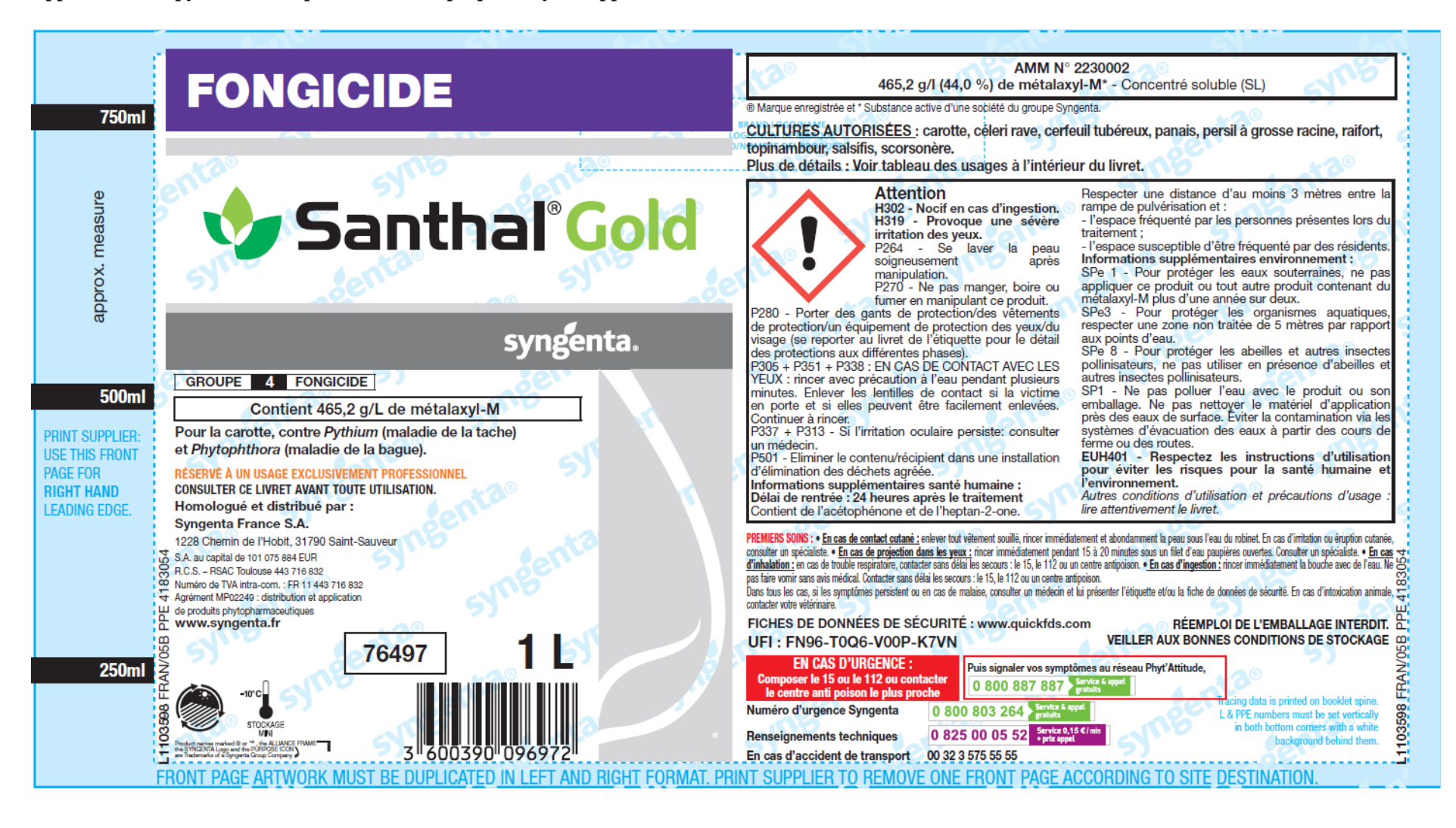
Appendix 2 – Copy of the draft product label as proposed by the applicant